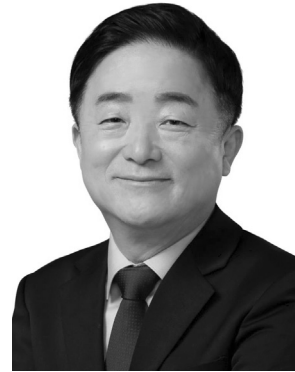
국회의원 강 득 구 (경기도 안양시 만안구)